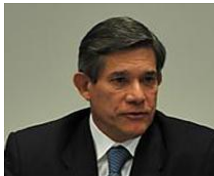
Freddy Padilla de León Embajador Plenipotenciario y Extraordinario de la República de Colombia ante los gobiernos de Austria, Croacia, Eslovaquia, Eslovenia, Hungría, República Checa y Serbia.

Freddy José Padilla de León, nacido el 10 de octubre de 1948 en Montería, Córdoba, Colombia, es un General de las Fuerzas Armadas de Colombia retirado. 6 Desde el 18 de octubre de 2010 él es el Embajador de Colombia en Austria así como el Representante Permanente de Colombia ante las Naciones Unidas en Viena. 7 Bajo esta función, también está acreditado como Embajador en Croacia, Serbia, Eslovaquia, Eslovenia, República Checa y Hungría. 8 Asimismo, también sirve como Representante Permanente en varios programas de las Naciones Unidas en Viena, por ejemplo, el Organismo Internacional de Energía Atómica y la Agencia de la Energía Nuclear, la Organización de las Naciones Unidas para el Desarrollo Industrial y la Oficina de las Naciones Unidas contra la Droga y el Delito. 9